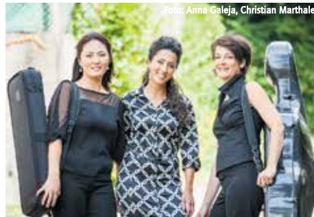
13. Nov.: Norea Trio