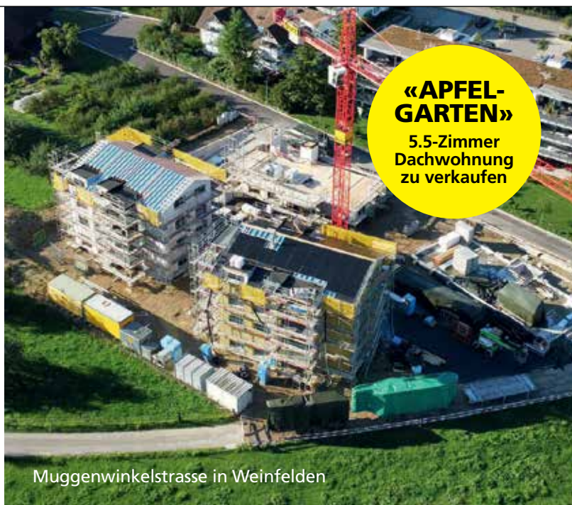
Muggenwinkelstrasse in Weinfelden

bornhauser-holzbau.ch holzbauplus ® holzbauvital