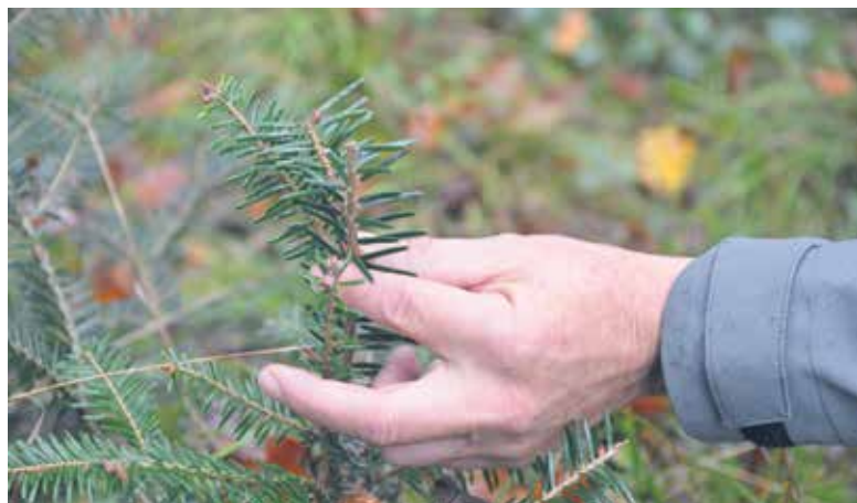
Verbisspuren von Rehen am Tannenzweiglein rechts. Die Knospen an den Zweiglein links sind noch vorhanden.

Seit 2001 wird im Kanton Thurgau eine systematische Verjüngungskontrolle im Wald durchgeführt. Eine Bilanz zeigt nun, dass sich in diesen 20 Jahren die Waldverjüngung auf einem Grossteil der Kantonsgebiete positiv entwickelt hat. Ein Frühindikator für die Entwicklung des Waldes ist der Verbiss junger Bäume durch Rehe. Die Häufigkeit der Verbisschäden wiederum beeinflusst die Regulierung des Rehwildbestandes.