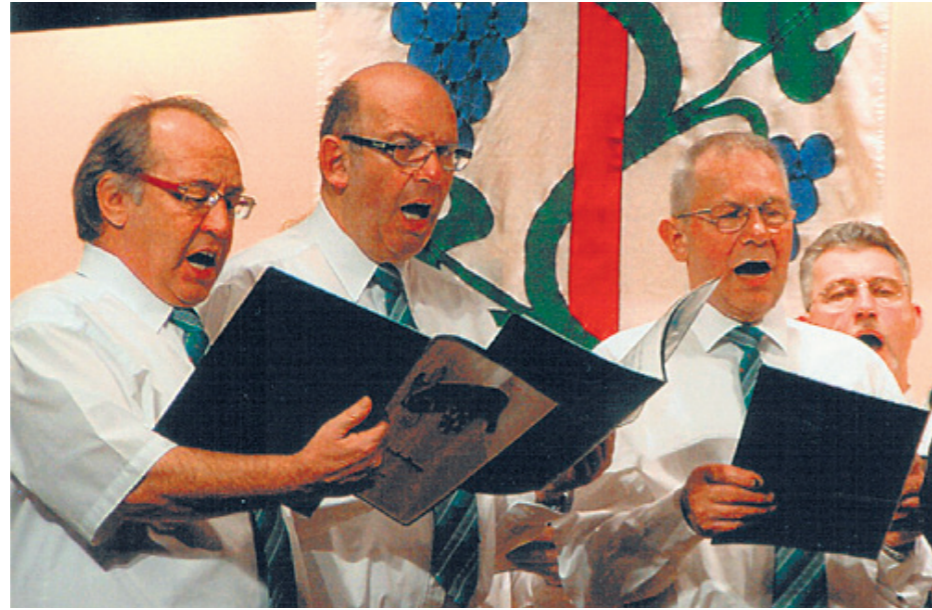
Der Männerchor in voller Aktion

Es ist nicht nur der Gesang, der die Sänger des Männerchors Frohsinn zusammen hält, son-