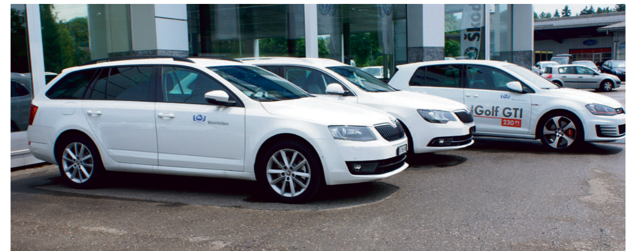
VW und Skoda, die Marken der AMAG Weinfelden