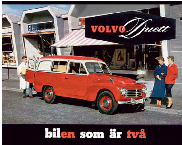
bilen som är två

Es war ein Überschuss an Fahrgestellen, der zur Entwicklung des ersten Kombis für Arbeit und Freizeit führte. 1.500 Fahrgestelle inklusive Antriebstechnik hatten sich im Frühjahr 1952 angesammelt. Seit 1949 lieferte Volvo diese Chassis an unabhängige Karosseriebauer in Schweden