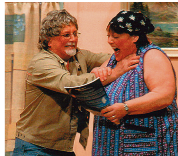
«Packende» Szene aus dem Theater