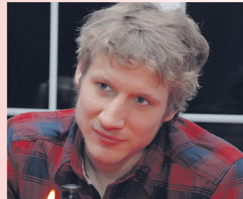
Schweizer Eishockeystar Damien Brunner

Mitreissend finde ich die Thriller von Simon Beckett. Ich habe in der Trainingspause drei seiner Werke verschlungen. Von Louise Erdrich lese ich zurzeit „Das Haus des Windes“. Von Daniel Glattauer liegt mit „Gut gegen Nordwind“ eher leichte, unterhalten-