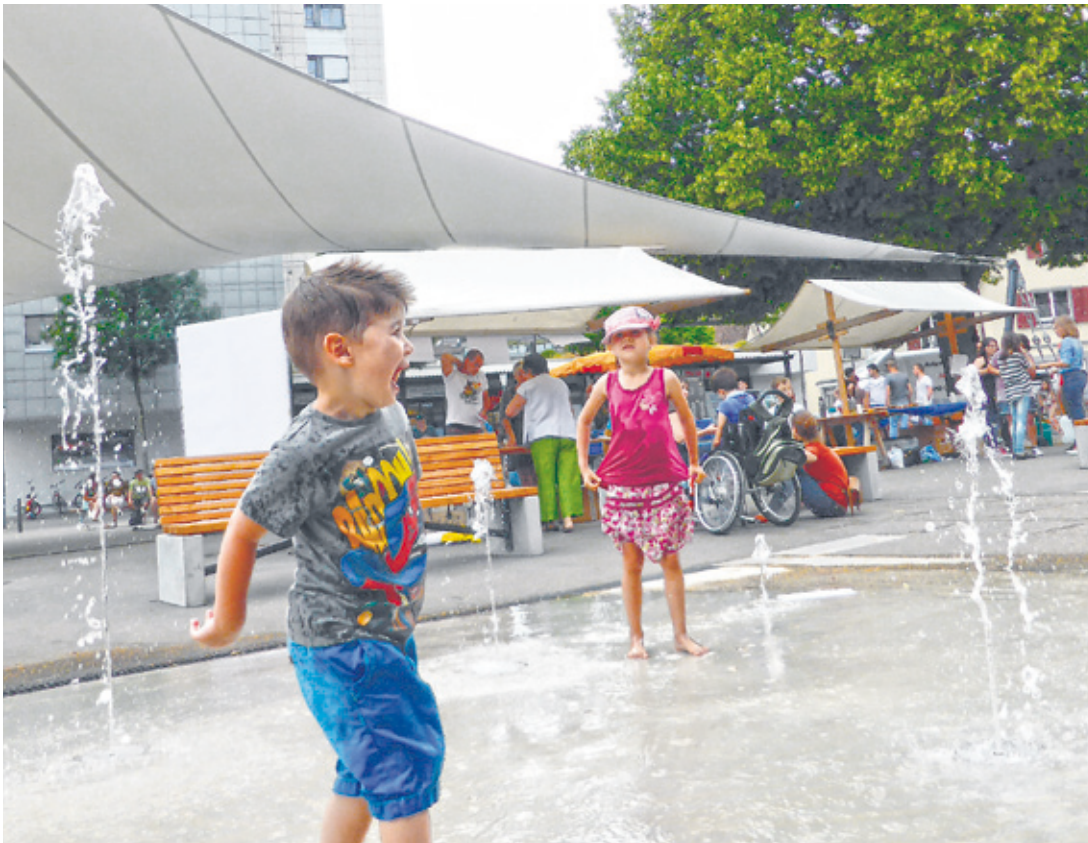
...und nicht nur das Wasserspiel. Gelungener Auftakt mit fröhlichen Kindern und kreativen Jugendlichen an der Eröffnungsfeier zur Belegung des Weinfelder Marktplatzes.