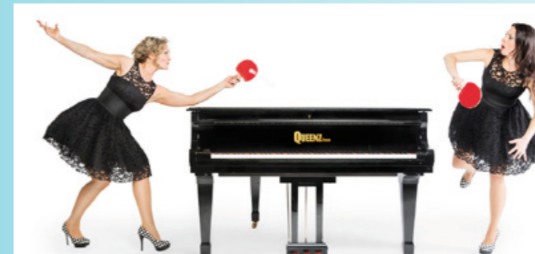
Queens of Piano

Farbig, geistreich, schön und verlockend: Das Jahresprogramm 2014/15 der Theater- und Konzertgesellschaft Mittelthurgau (TKGMtg) ist attraktiv. Der Weinfelder Verein organisiert unter dem ehrenamtlich wirkenden Vorstand vier Theater und vier Konzerte, die als Gesamtpaket einen kulturellen Hochgenuss versprechen.