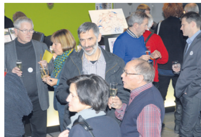
Gute Stimmung beim Apéro im Kino-Foyer