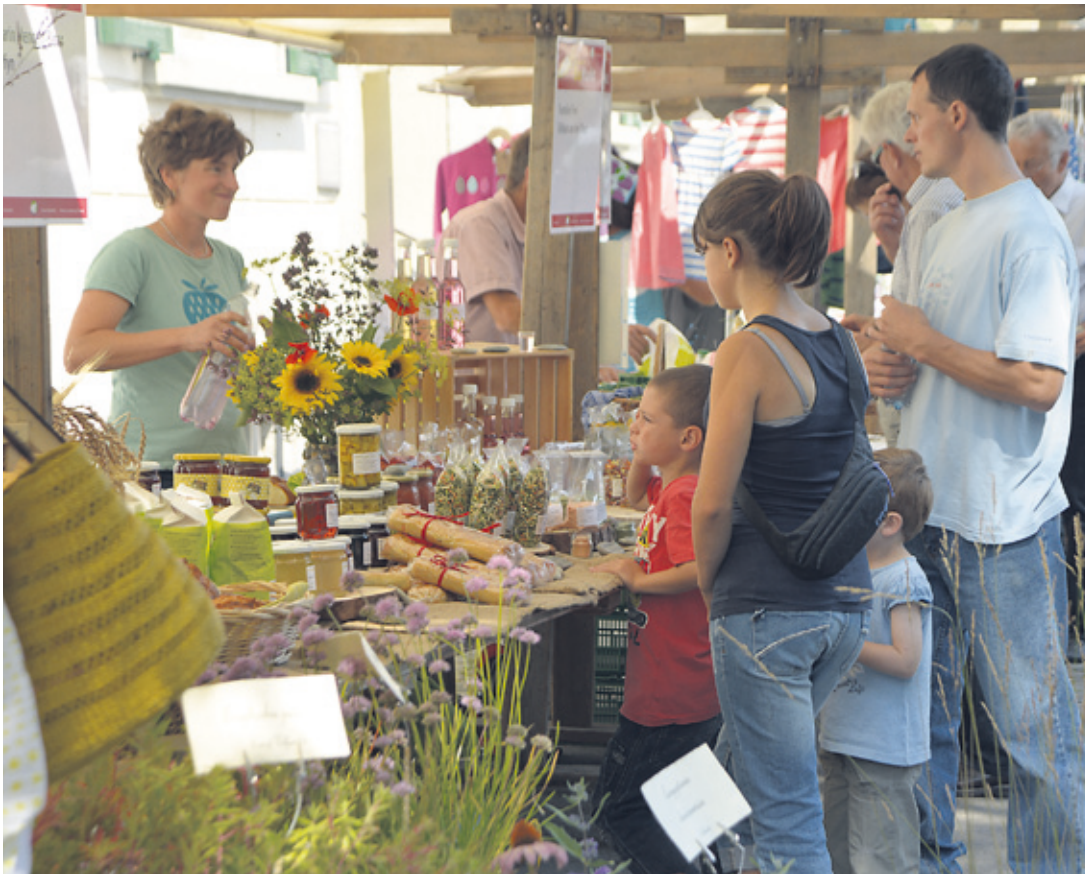
Bereits zum zehnten Mal in Serie wird am Samstag, 30. August der Ostschweizer BioMarkt in Weinfelden stattfinden.