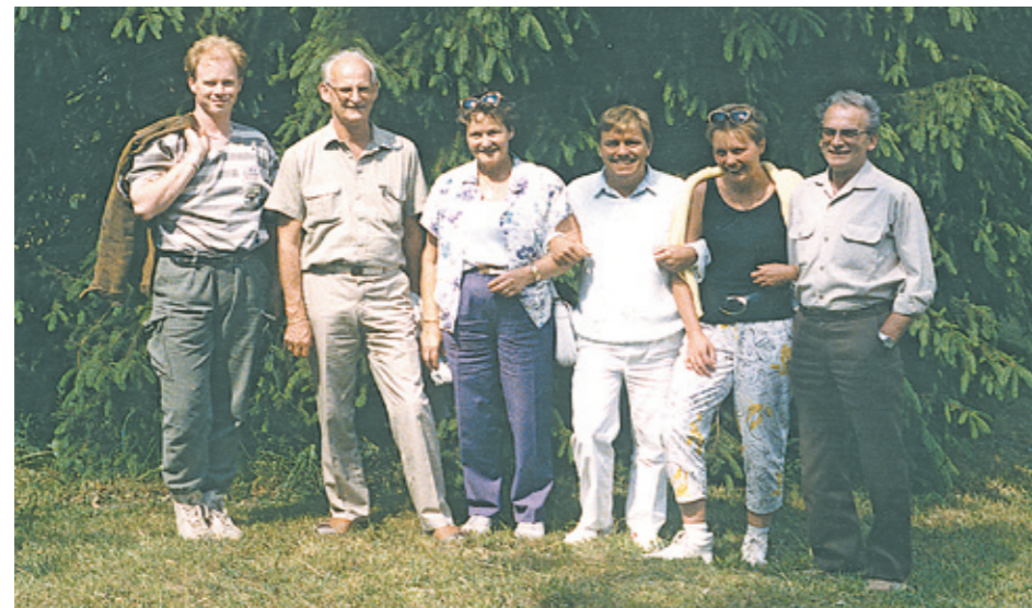
Das RIEF-Team in den 80-er und 90-er Jahren

Kellergeschoss gehoben werden konnten. Ebenso erinnere ich mich, dass wir auch einmal das Fernsehen in unserem Betrieb hatten. In einer Sendung wurde die Vereinigung «Senior mach mit» vorgestellt, deren Quartalsheft seit vielen Jahren bei uns hergestellt wird.