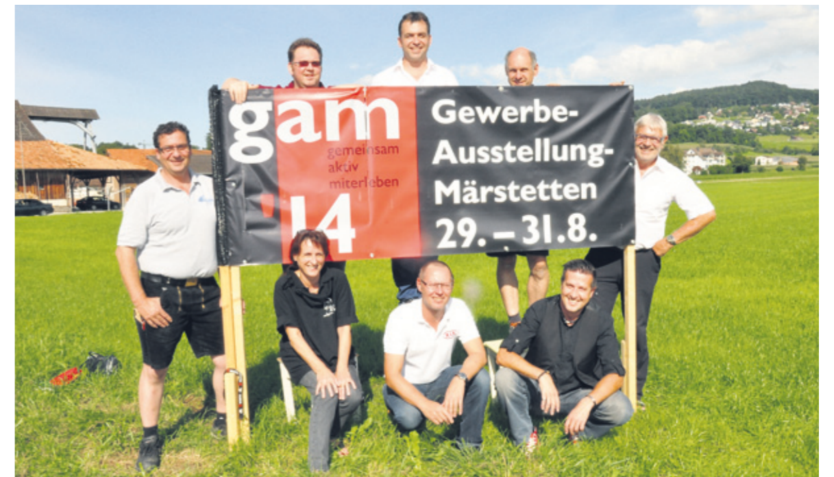
Das OK der fünften Märstetter Gewerbeausstellung steht inmitten der Vorbereitungen für seinen bevorstehenden Anlass.

Nach dem Erfolg der vergangenen letzten Ausstellungen entschlossen sich die Verantwortlichen des Gewerbevereins, auch eine fünfte Durchführung ins Auge zu fassen und das Konzept der vergangenen Ausstellungen beizubehalten. Unter dem Motto «gemeinsam-aktiv-miterleben» möchten die Organisatoren der Bevölkerung von Märstetten und Umgebung die Stärken des regionalen Gewerbes aufzeigen. «Dabei bietet sich die Gelegenheit, bestehende Kundenbeziehungen zu pflegen und neue Kontakte zu knüpfen»,