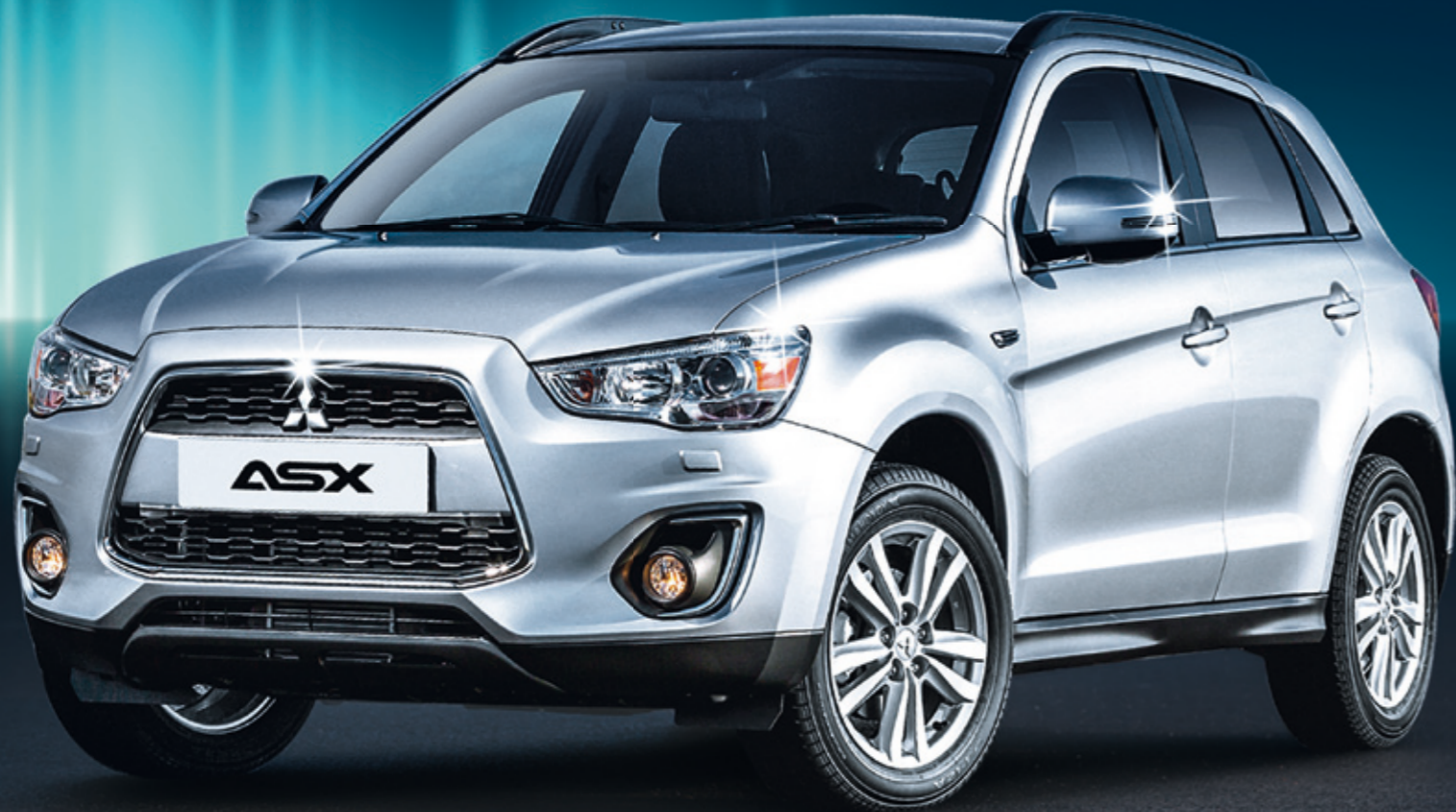
Abb. ASX 2.2 DID Navigator Automat, 4x4, 150 PS

Entdecken Sie die attraktive Mitsubishi Palette mit vielen neuen Modellen, vom City-Flitzer Space Star über den Compact Crossover ASX 4x4 (neu mit Automat), den Familien-SUV Outlander 4x4 bis zum Super-Sportwagen Lancer Evolution Turbo mit 295 PS oder die robusten 4x4 Zugfahrzeuge (ziehen bis 3.5 Tonnen) Pajero und L200 Pickup. Die Garage Krapf AG als neuer Mitsubishi Partner freut sich auf Ihren Besuch.