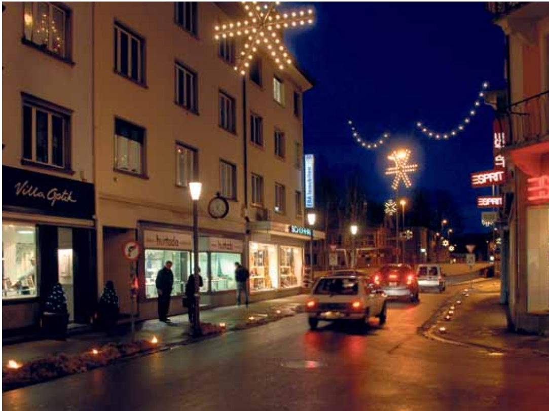
Attraktives Weihnachtseinkaufen im weihnächtlichen Weinfelden auf den Seiten 11, 12 und 13.