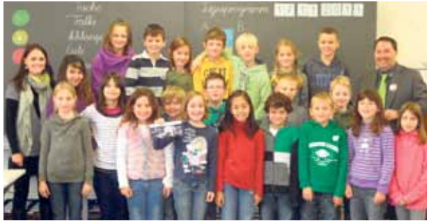
1. Platz, Drittklässler vom Martin-Hafterschulhaus

Der Wettbewerb, bei dem die Kinder die WEGA einmal aus Ihrem Blickwinkel zeichnen sollten, fand so nun seinen Abschluss.